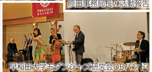
早稲田大学モダンジャズ研究会OBバンド