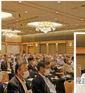
会場ぎっしりの参加者