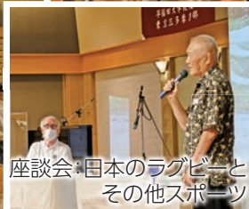
座談会・日本のラグビーと その他スポーツ