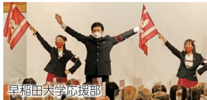
早稲田大学応援部