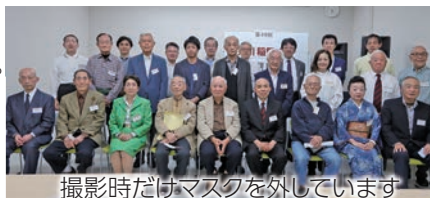
撮影時だけマスクを外しています

懇親会は行われなかったこととなります。来年は50回目の記念の年、ぜひとも懇親会を実現したいものです。