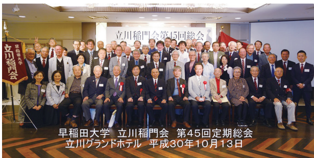
早稲田大学 立川稲門会 第45回定期総会 立川グランドホテル 平成30年10月13日

平成30年10月13日（土）午後5時30分より、立川グランドホテルにて開催されました。